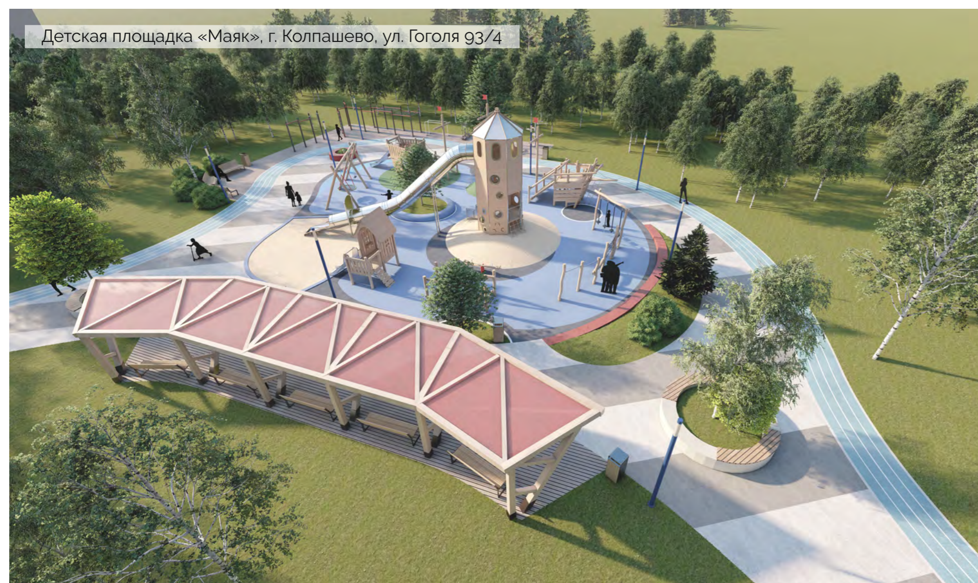
Детская площадка «Маяк», г. Колпашево, ул. Гоголя 93/4